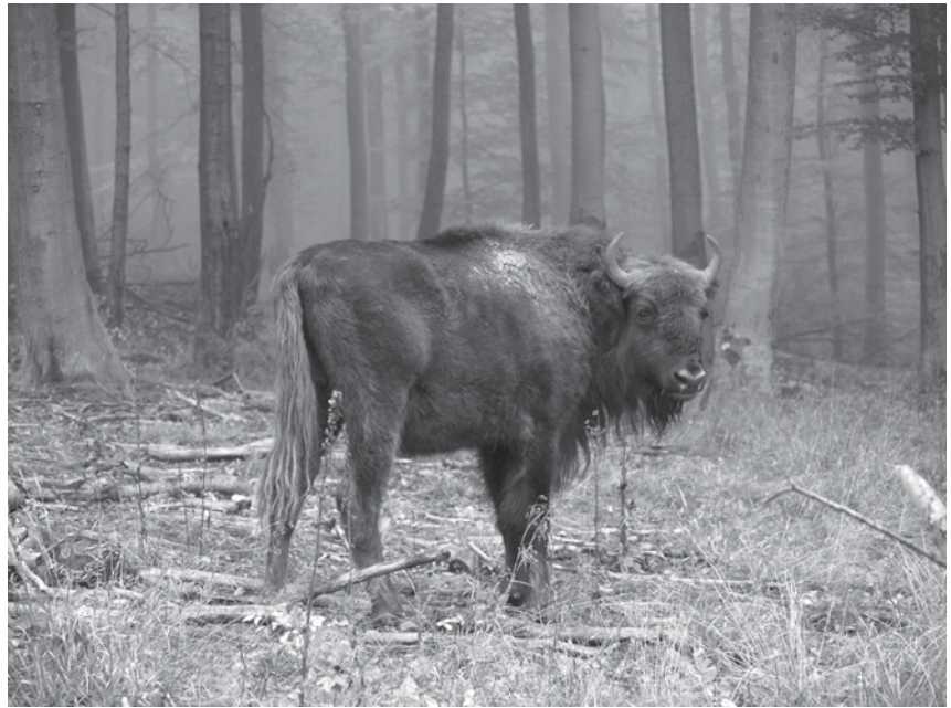
Abb. 2: Junge Wisentkuh im Hainsimsen-Buchenwald des Eingewöhnungsgeheges im Rothaargebirge.

Die Diskussion der jeweiligen Ergebnisse und die Entwicklungen in den einzelnen Teilprojekten findet im Rahmen einer Projektbegleitenden Arbeitsgruppe statt, die wiederum die Erkenntnisse und den Projektstand der oben vorgestellten Steuerungsgruppe zur Diskussion unterbreitet und damit auch veröffentlicht.